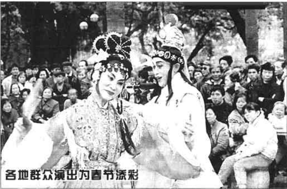
各地群众演出为春节添彩

新华社北京2月10日电(记者 李佳路)IC卡也称集成电路卡,是一种用途广泛的智能卡。