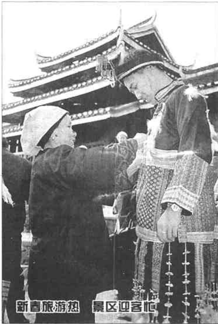
新春旅游热 景区迎客忙

春节期间,各地城乡群众文艺团体纷纷开展丰富多彩的文化活动,为节日增添了喜庆气氛。